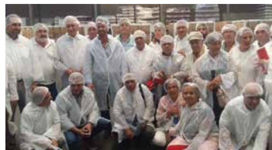
Επίσκεψη στο εργοστάσιο επεξεργασίας ελαιών ΔΕΑΣ ΑΕ

Το πρόγραμμα της ημέρας θα ολοκληρώνονταν με την επίσκεψη της Τουρκικής Αντιπροσωπείας στο εργοστάσιο επεξεργασίας ελαιών ΔΕΑΣ ΑΕ, στο Δημαρχείο Σιθωνίας όπου θα πραγματοποιούσε συνάντηση με τον Δήμαρχο και τους Αντιδημάρχους και θα τελείωνε με περιήγηση στο 2ο πόδι της Σιθωνίας.