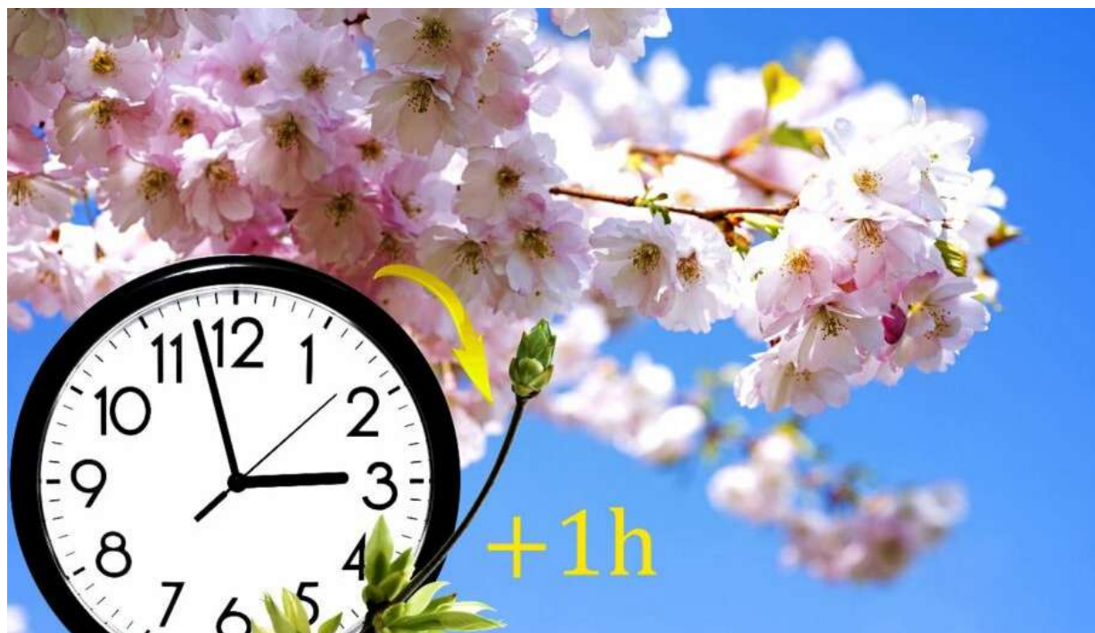
Sakura branch against the blue sky.