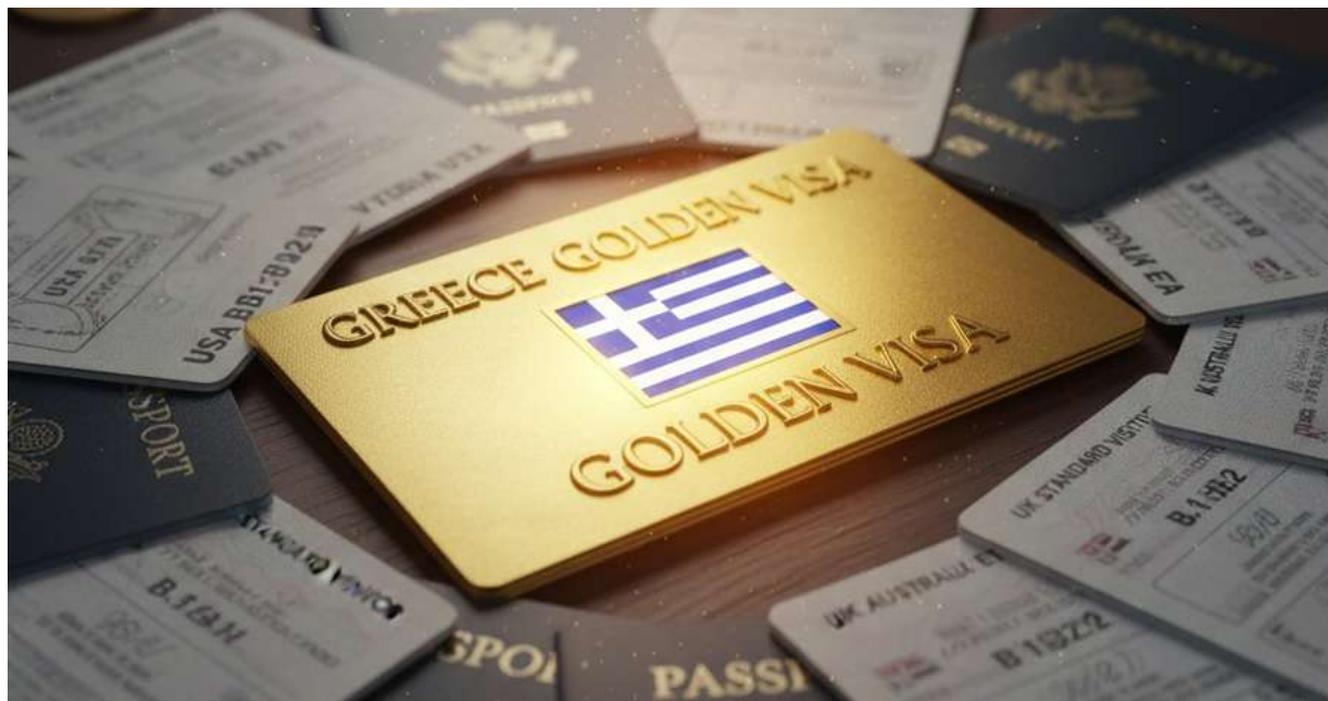
golden visa ellada